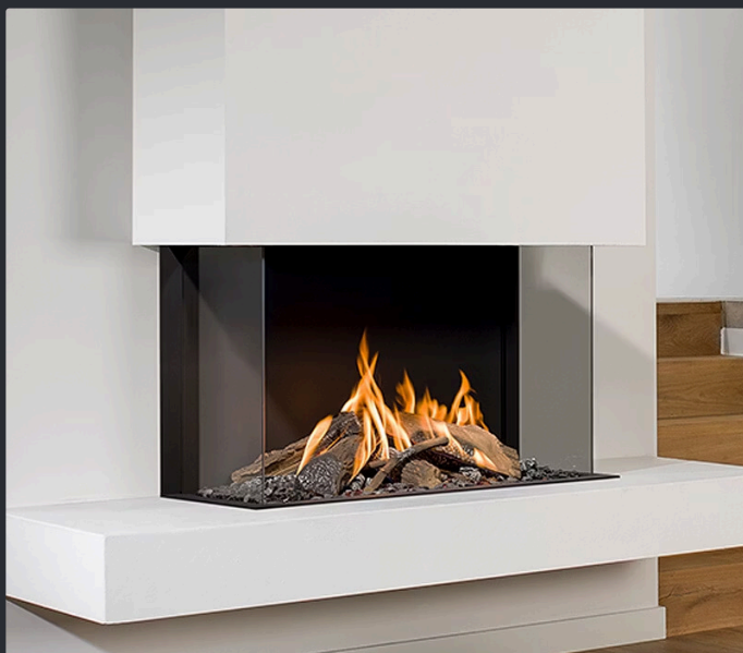
Bellfires View Bell Medium 3