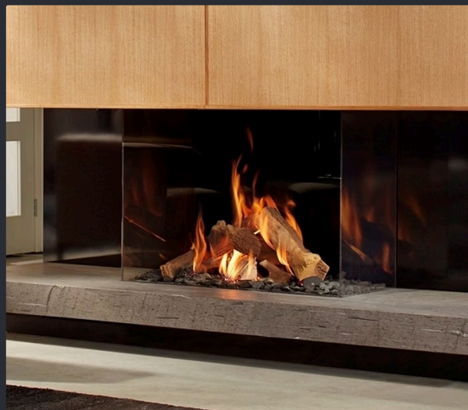
DRU Maestro 80/3 Eco Wave